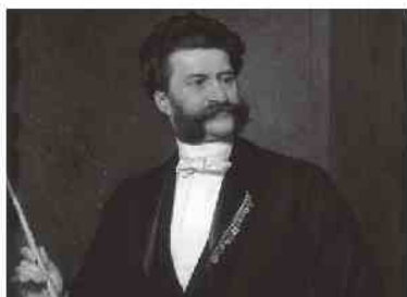
Johann Strauss (υιός, 1825-1899)

Η «οπερέτα» ως νέο είδος δημιουργήθηκε στα μέσα του 19ου αιώνα στο Παρίσι. Ο Όφφενμπαχ ξεκίνησε να γραφεί τις λεγόμενες opéra bouffe , που λαϊκά αποκαλούνταν «οπερέτες», με πρώτη τον « Ορφέα στον Άδη ». Σ' αυτά τα έργα ο Όφφενμπαχ σατίριζε τόσο τη μεγάλη γαλλική όπερα όσο και τις πολιτικές-κοινωνικές καταστάσεις της εποχής του με μουσική υψηλών προδιαγραφών. Σχετικά σύντομα, το νέο είδος πέρασε και στην Αυστρία, όπου όμως αρχικά τονίστηκε απλώς το κωμικό στοιχείο και στη συνέχεια όλο και περισσότερο το συναισθηματικό, με συνέπεια να υποβαθμιστεί κάπως το επίπεδο σε σχέση με την όπερα, κυρίως ως προς την πλοκή των έργων. Μετά τον Β' Παγκόσμιο Πόλεμο, η οπερέτα αντικαταστάθηκε από το μιούζικαλ, που παρουσίαζε πιο ρεαλιστικά θέματα, ξεφεύγοντας από την καθιερωμένη χρήση των ανάλαφρων βαλς. Βέβαια, στη Γερμανία και στην Αυστρία, οι πιο δημοφιλείς μελωδίες από τις πετυχημένες οπερέτες τραγουδιούνται ακόμη μέχρι σήμερα. Σ' αυτό συνέβαλε η μεταφορά τους στον κινηματογράφο ή στην τηλεόραση, αναζωπυρώνοντας τη νοσταλγία για έναν κόσμο πιο απλό πριν από τον πόλεμο.