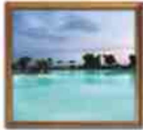
***** Sirena LIMASSOL