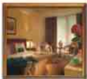
***** AOTI Autumn Park LIMASSOL