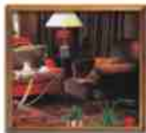
***** Sirena Grand LIMASSOL