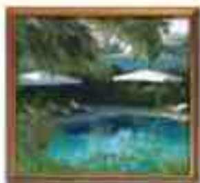
***** Sirena Grand LIMASSOL