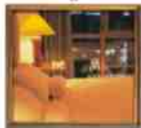
***** Glyfada GLYFADA