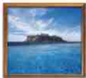
***** Riga Beach Hotel RIGA