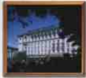
***** Theodoros Tzolis Sparta