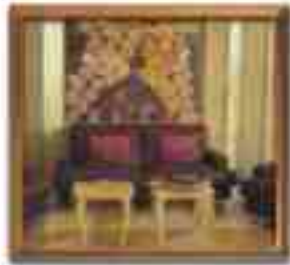
***** Academy ATHENS