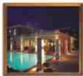
***** Piraeus Jolie Suites PIRAEUS