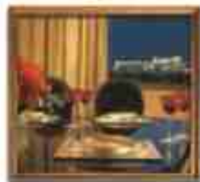
***** Aurora Suites ATHENS