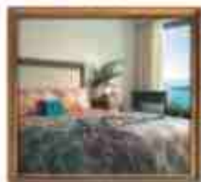
***** Vasilissas Hotel ATHENS