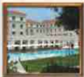
***** Ariston Suites ATHENS