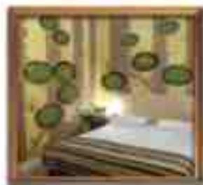
***** Riga Grand RIGA