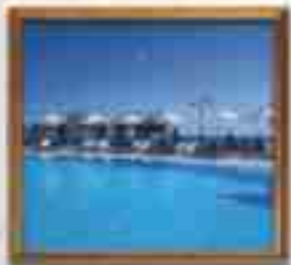
***** Aria Hotel CORINTH