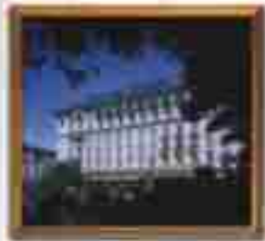
***** Sofisticated *****