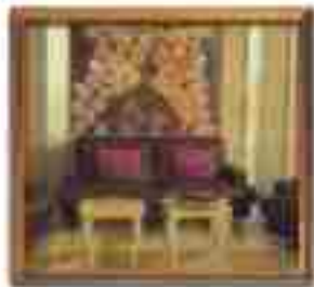
***** Acropolis *****