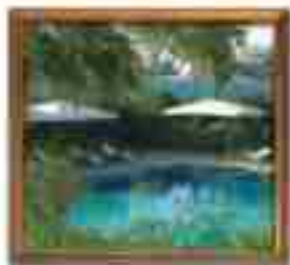
***** Sofisticated *****