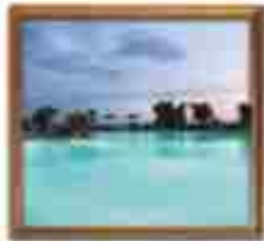
***** Sofisticated *****