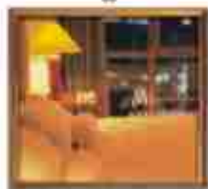
***** Sofisticated *****