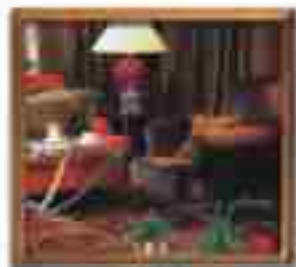
★★★★ Europa del Sol Cabo San Lucas Baja California Sur