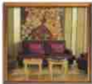
★★★★ Alcazar Cancun Quintana Roo