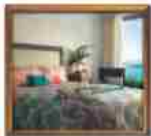
★★★★ Yves Hotel Cancun Quintana Roo