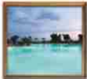
★★★★ Silicon Cancun Quintana Roo