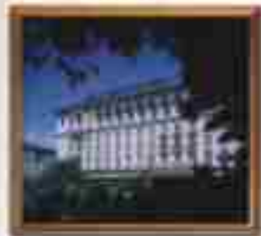
★★★★ Hotel del Sol Cabo San Lucas Baja California Sur