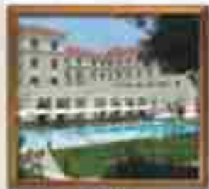
★★★★ La Costa Antigua Antigua Guatemala