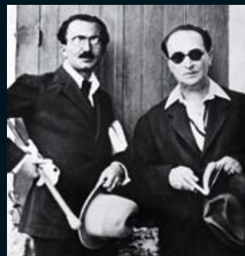
Με τον Άγγελο Σικελιανό, 10 Οκτωβρίου 1920.