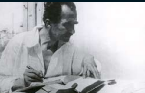
Στην Αίγινα, συγγράφοντας το ελληνογαλλικό λεξικό, Άνοιξη 1931.