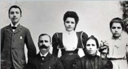
Στο Ηράκλειο, το 1900, με τους γονείς και τις αδελφές του.

Ο Νίκος Καζαντζάκης γεννήθηκε στο Ηράκλειο, την πρωτεύουσα της τουρκοκρατούμενης Κρήτης, στις 18 Φεβρουαρίου 1883.