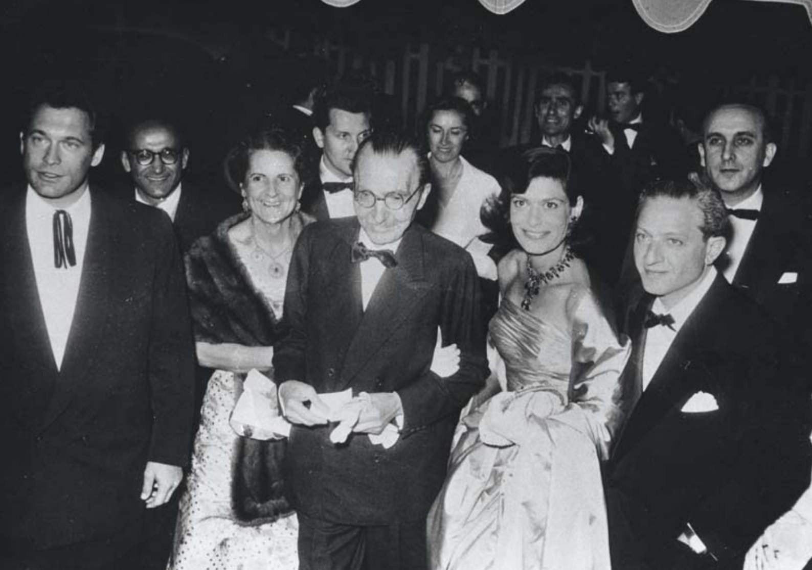
Μελίνα Μερκούρη, Jules Dassin και το ζεύγος Καζαντζάκη στην πρεμιέρα της ταινίας "Celui qui doit mourir" (Αυτός που πρέπει να πεθάνει), σε σκηνοθεσία Jules Dassin, στο Φεστιβάλ των Καννών (1957).