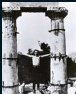
Στο ναό της Αθηνάς Αφείας στην Αίγινα, 1927.