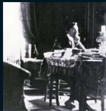
Φοιτητής στο Παρίσι, 1908.

Την εποχή του Μεσοπολέμου και ενώ η Ευρώπη απειλείται από την άνοδο του φασισμού, ο Καζαντζάκης, ακούραστος, συνεχίζει τις περιπλανήσεις του στον κόσμο και ξεκινά τη σύνθεση της «Οδύσσειας». Η παράξενη αντιστοιχία του βίου και του έργου φαίνεται σχεδόν αλληγορική. Στα 14 χρόνια των επτά διαδοχικών γραφών της «Οδύσσειας», ο Καζαντζάκης ταξιδεύει στην Κύπρο, την Παλαιστίνη, την Αίγυπτο το Σινά, και την Ιαπωνία, ενώ επισκέπτεται την Ιταλία, τη Σοβιετική Ένωση, και την Ισπανία. Κατά καιρούς διαμένει στην Ευρώπη, ενώ το ελληνικό του σπίτι βρίσκεται στην Αίγινα, όπου περνά τον περισσότερο χρόνο του στην Ελλάδα. Οι ρυθμοί του είναι πυρετώδεις: γράφει κινηματογραφικά σενάρια, ποίηση, δραματικά έργα, μυθιστορήματα στα γαλλικά, εγκυκλοπαιδικά και γλωσσικά λεξικά, σχολικά βιβλία. Ταυτόχρονα, αρθρογραφεί σε ελληνικές και ρωσικές εφημερίδες, μεταφράζει σημαντικά λογοτεχνικά κείμενα αλλά και παιδικά αναγνώσματα.