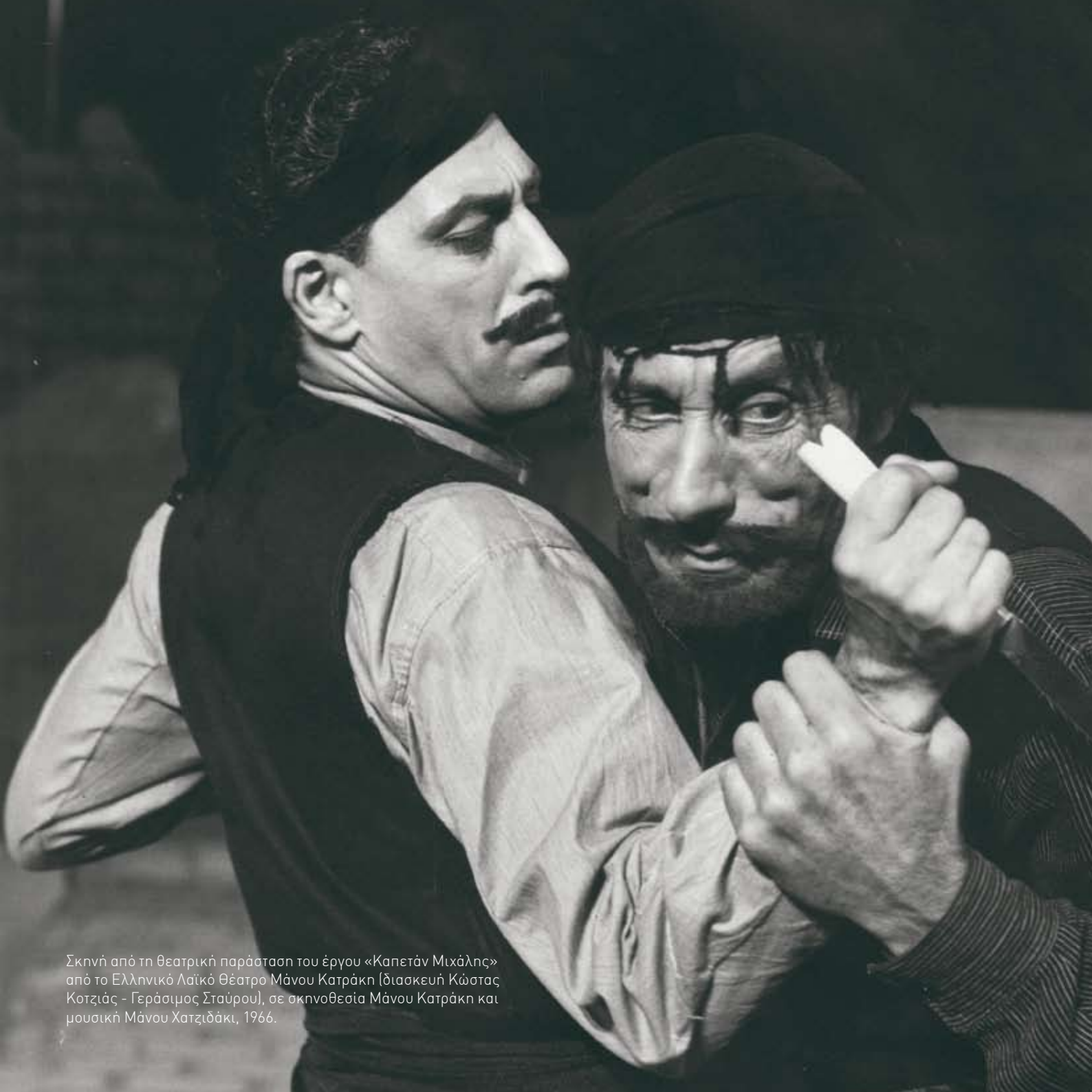
Σκηνή από τη θεατρική παράσταση του έργου «Καπετάν Μιχάλης» από το Ελληνικό Λαϊκό Θέατρο Μάνου Κατράκη (διασκευή Κώστας Κοτζιάς - Γεράσιμος Σταύρου), σε σκηνοθεσία Μάνου Κατράκη και μουσική Μάνου Χατζιδάκι, 1966.