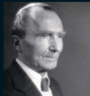
Αθήνα, Μάρτιος 1945.