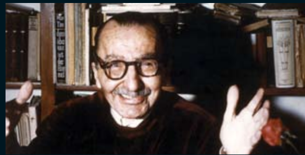
Ο Νίκος Καζαντζάκης στο γραφείο του, στην Αντίπολη (Antibes, Γαλλία), 1956.