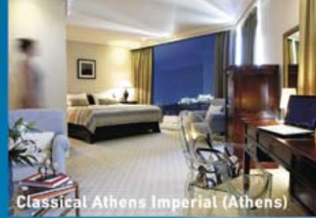
Classical Athens Imperial (Athens)