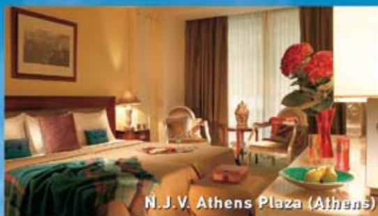
N. J. V. Athens Plaza (Athens)