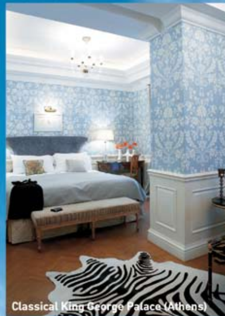
Classical King George Palace (Athens)