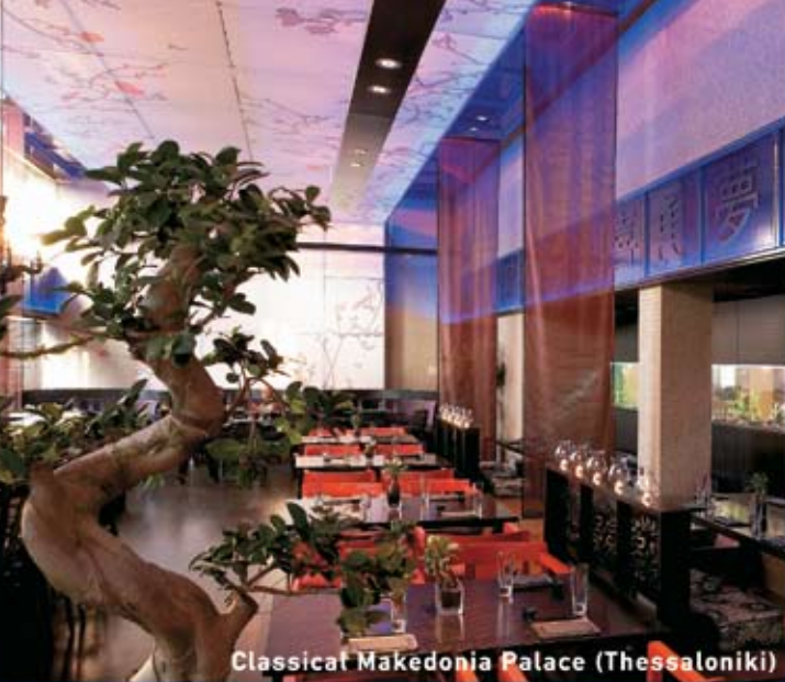
Classical Makedonia Palace (Thessaloniki)