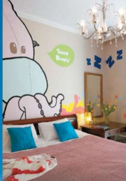
Classical Baby Grand Hotel (Athens)