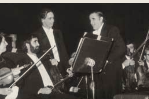
Ο διεθνούς φήμης τυφλός Θεσσαλονικιός πιανίστας Γιώργος Θέμελης με τον μαέστρο Αλέξανδρο Μιχαηλίδη το 1978.

Μέσα από τα νέας υφής προγράμματα συναυλιών, που ανανεώθηκαν ως προς το περιεχόμενό τους και φιλοξενούσαν πλέον τακτικότερα έργα Ελλήνων δημιουργών, αλλά και άλλες νεότερες δημιουργίες, κυρίως του 20ου αιώνα, ο Μπαλτάς αναζήτησε και προσπάθησε να εκφέρει μία ελκυστικότερη μουσική πρόταση που να συνδυάζει και έναν έξυπνα παιδευτικό χαρακτήρα προς το κοινό της ορχήστρας.