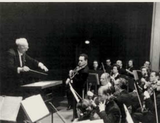
Ο κορυφαίος βιολονίστας Henryk Szeryng συμπράττει με την ΣΟΒΕ το 1966. Διευθύνει ο Σόλων Μιχαηλίδης.