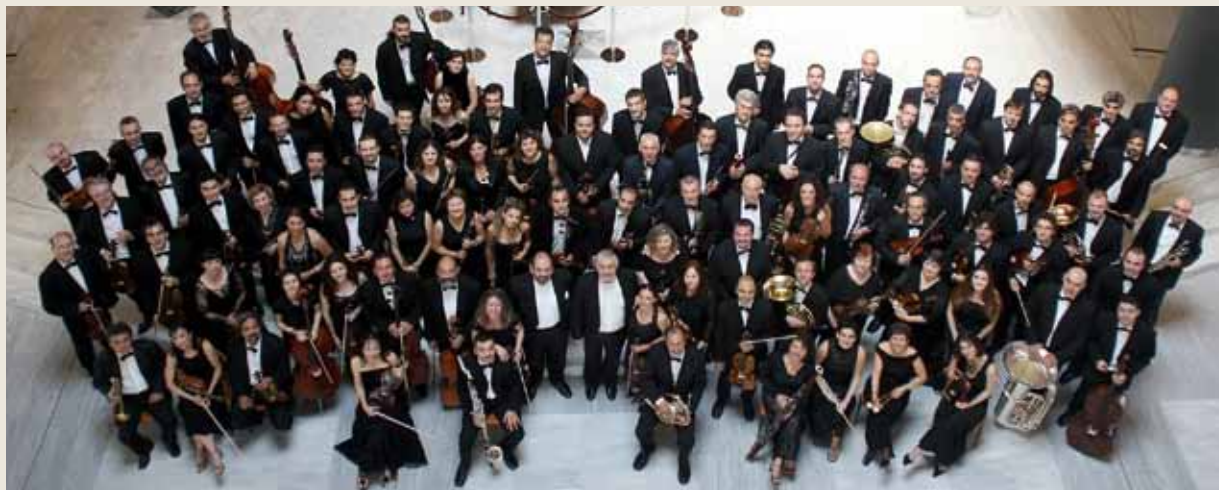
Η Κρατική Ορχήστρα Θεσσαλονίκης σε μία πρόσφατη φωτογραφία της.

λης», ένας θησαυρός που καλούνται όλοι οι Θεσσαλονικείς να γνωρίσουν και μαζί να γευτούν τη ζωντανή ποιοτική μουσική. Όχι όμως σαν ένα μουσειακό έκθεμα. «Τα αριστουργήματα της συμφωνικής μουσικής μπορούν να γίνουν μια καλή συντροφιά, ένα ζωντανό ποίημα, ένα πολύχρωμο όνειρο, ένα ταξίδι...».