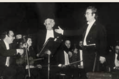
Ο μαέστρος Οδυσσεάς Δημητριάδης με τον Γιάννη Βακαρέλη το 1976. Εξάρχων της ΚΟΘ ο Κοσμάς Γαλιλαίας.

γκόσμια εκτέλεση και ήρθε σε επαφή με μνημειώδη αριστουργήματα του ρεπερτορίου, όπως τα συμφωνικά ποιήματα του Ρίχαρντ Στράους και οι συμφωνίες των Μάλερ και Μπρούκνερ.