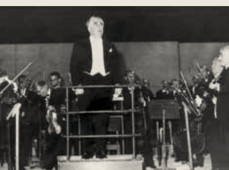
Ο αρμενικής καταγωγής συνθέτης Αράμ Χατσατουριάν στο πόντιουμ της ΣΟΒΕ.

Ένα από τα μεγαλύτερα επιτεύγματα της ΚΟΘ υπήρξεν η εκτέλεσις της Ενάτης Συμφωνίας του Μπετόβεν τον Οκτώβριο του 1967, εις πρώτην εκτέλεσιν στην Θεσσαλονίκη...»